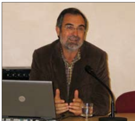
El senador, Pere Sampol.

El 2009 ha estat un any en què aquesta qüestió ha estat damunt la taula a bastament. Les exigències a l'Estat de comunitats com Catalunya o les Illes Balears, perjudicades pel sistema de finançament durant aquests anys, ha posat de manifest les mancances del sistema, i les reivindicacions del PSM