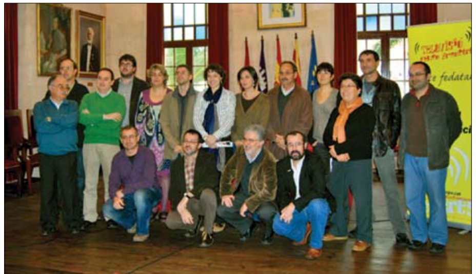
A Menorca, la iniciativa es va presentar a l'Ajuntament de Ciutadella el passat dia 3 de desembre.

institucions com el Ple del Consell Insular de Menorca. Açò durà feina, per açò, i n'hi ha molta per fer. Però cal ser responsables i no jugar a dobles cares. En aquest sentit, el posicionament del PSOE en la defensa de la ILP no deixa de ser contradictori. Principal responsable dels ministres d'Indústria dels darrers anys, claus per a la consecució d'un marc legal que possibiliti una bona reciprocitat, i, sobretot, responsable de l'obertura del múltiplex autonòmic que, després de mesos i mesos, no arriba, per molt que s'anuncii, el Partit Socialista Espanyol pretén mostrar una cara que no concorda amb les accions que ha tingut a l'abast. Haurem d'esperar per saber si la iniciativa po-