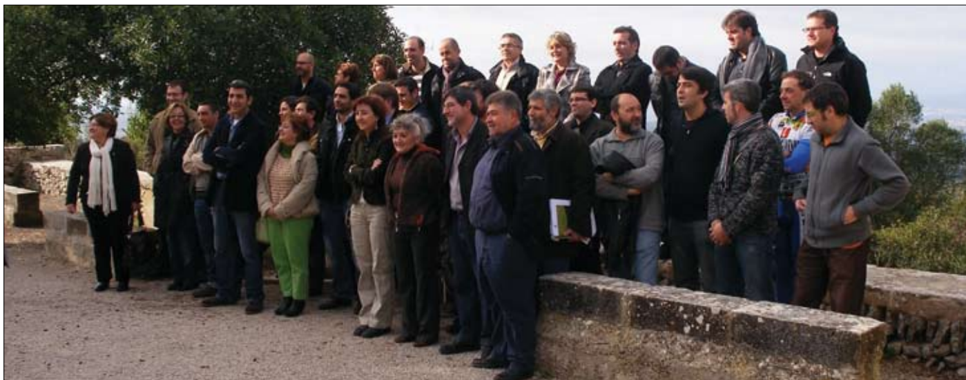
Representants del PSM van assistir a l'acte de constitució de la Plataforma celebrat el dia 12 de desembre passat al Monestir de Cura (Mallorca).