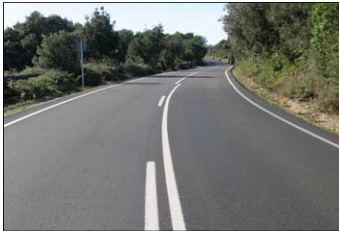
El Pla de Carreteres definirà les necessitats de la xarxa viària de l'illa.

Tal i com està previst, l'actualitat de la confecció d'aquest pla du a fer consideracions sobre la carretera general per