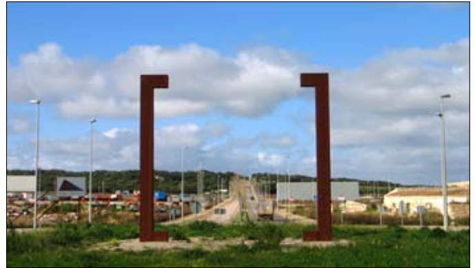
Als polígons industrials es permet actualment l'ús comercial.

Però la realitat comercial de Menorca en aquests moments permet que la majoria de polígons industrials de l'illa compaginin l'ús comercial amb l'ús industrial i, a punt d'entrar en vigor la Normativa europea de serveis que aposta per la lliure circulació de serveis i la llibertat d'establiments, el PSM considera del tot necessari l'existència de la Norma territorial cautelar aprovada inicialment pel